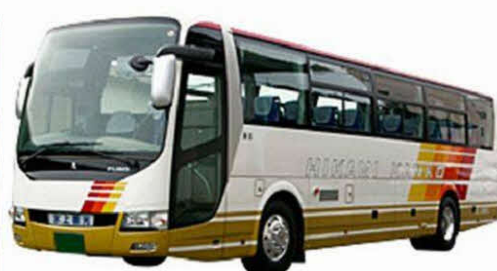
水上観光バス大型バス利用